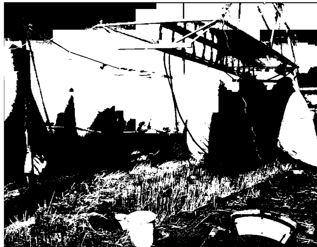
Рис. 1 – Лабораторно-полевая дождевальная установка Fig. 1 – Laboratory-field rainfall simulator

Лабораторно-полевая дождевальная установка (ДУ) (рис.1) предназначена для исследования влияния дождевых осадков на сток воды, смыв почвы, вынос химических веществ в различных агроэкосистемах (патент на изобретение 2417578).