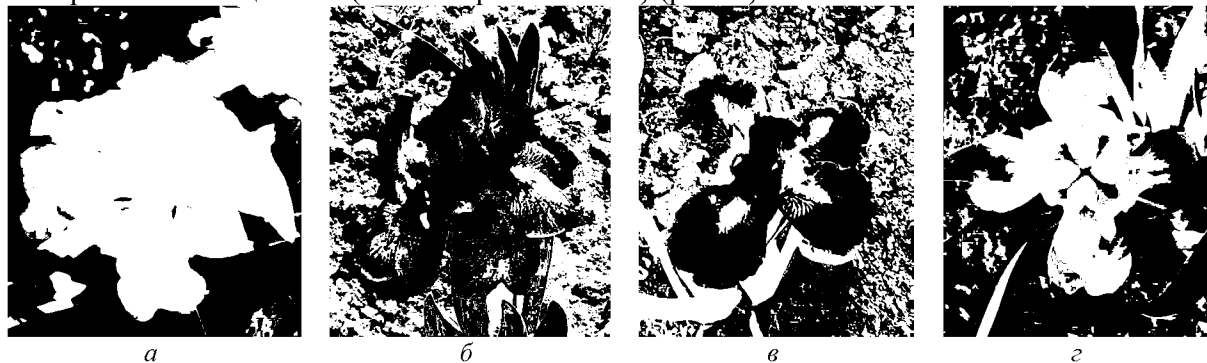
Рис. 2 – Махровые (4-членные) цветки сортов низкорослых бородатых ирисов:

У некоторых сортов низкорослых бородатых ирисов, таких как ‘Bright White’, ‘Firestorm’, ‘Hottentot’, ‘Peach Bavarian’, регулярно встречаются махровые четырехчленные цветки (вместо трехчленных) (рис. 2).